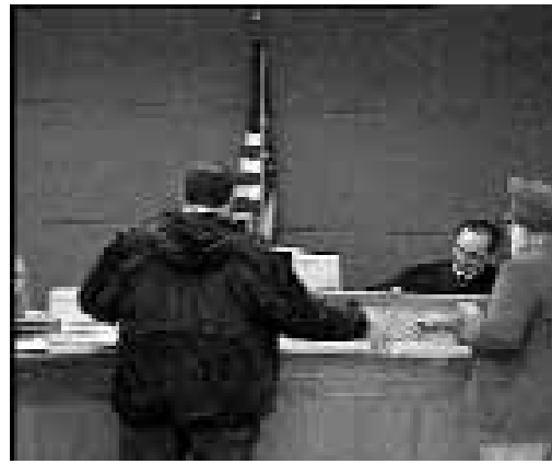
Un representante del Proyecto Justicia en la Vivienda (HJP) ayuda a un residente del condado King, en el estado de Washington, que enfrenta la pérdida de su vivienda debido a una orden de desalojo.

En 1992, el Colegio de Abogados del Estado de Washington (WSBA) resolvió que todos sus abogados afiliados debían contribuir a los "servicios jurídicos de interés público" provistos a personas de bajos ingresos o a las cuestiones conce-